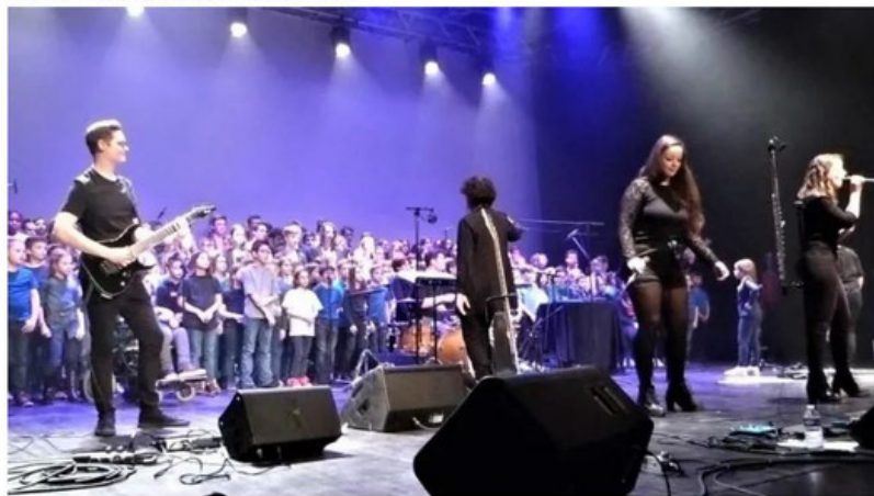
Chant final avec Mirage et deux cents jeunes choristes.

Publié le 10/02/2020 à 06:25 | Mis à jour le 10/02/2020 à 06:25