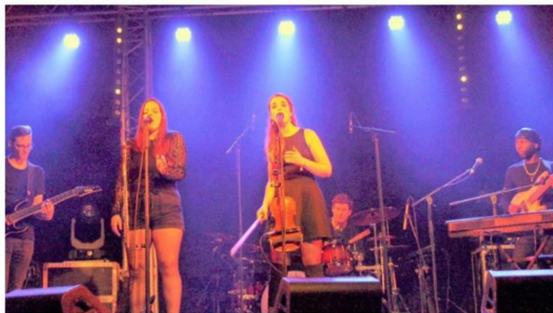
Il fallait un gagnant et c'est le groupe Mirage !

Publié le 14/12/2019 à 06:26 | Mis à jour le 14/12/2019 à 06:26