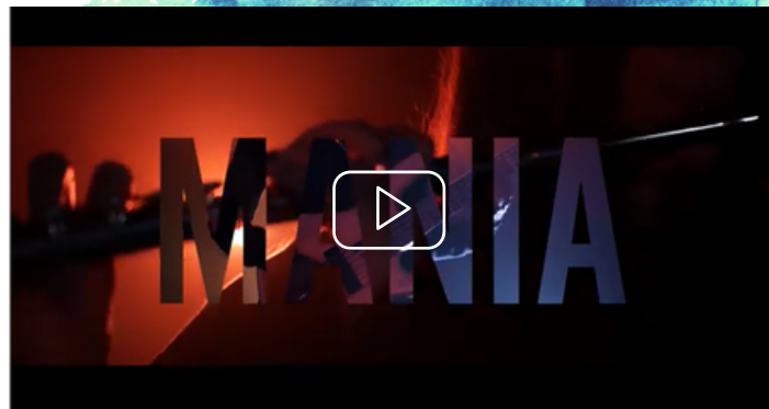
MIRAGE - Mania (Clip)