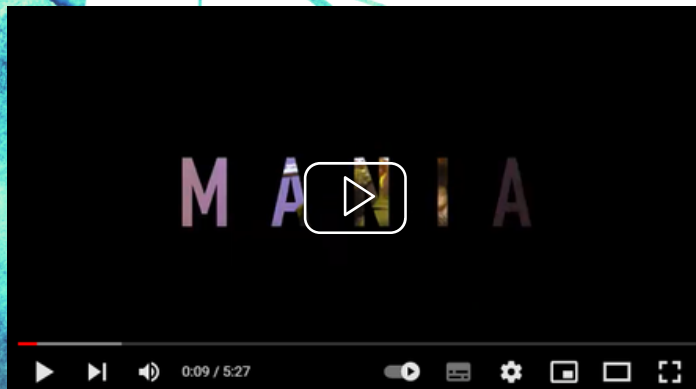
MIRAGE - Mania (Live) avec la Chorale du Lycée Grandmont